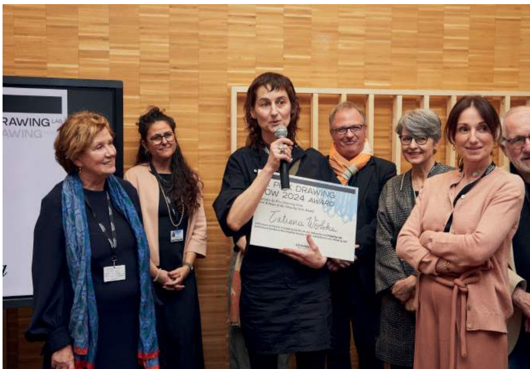
Remise du Prix Drawing Now 2024

Le Prix Drawing Now accompagne depuis 14 ans la création contemporaine et souligne le rôle défricheur des galeries, en récompensant le travail d'un·e artiste présentée sur le stand de sa galerie lors de Drawing Now Paris.