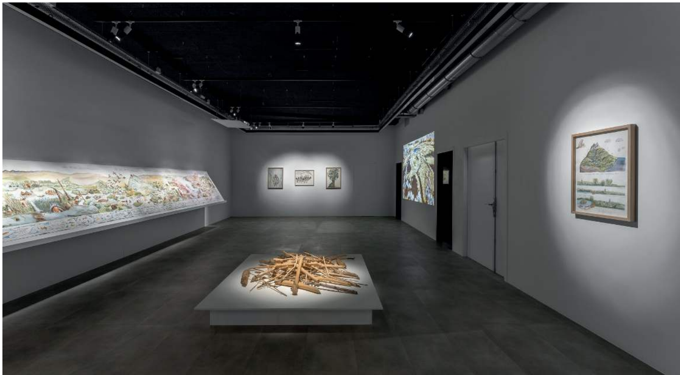
Vue de l'exposition Le temps profond des rivières , Suzanne Husky, lauréate du Prix Drawing Now 2023, du 26 janvier au 7 avril 2024

Fondé par Christine Phal en 2017 sur un modèle philanthropique, le Drawing Lab est un espace d'expérimentations et d'expositions privées entièrement dédié à la promotion du dessin contemporain.