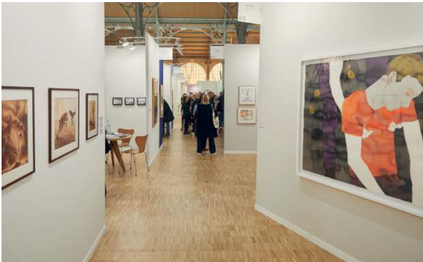
Vue de Drawing Now Art Fair 2024

La 18 e édition de Drawing Now Paris, première foire d'art contemporain dédiée au dessin en Europe, aura lieu du 26 au 30 mars 2025 au Carreau du Temple à Paris.