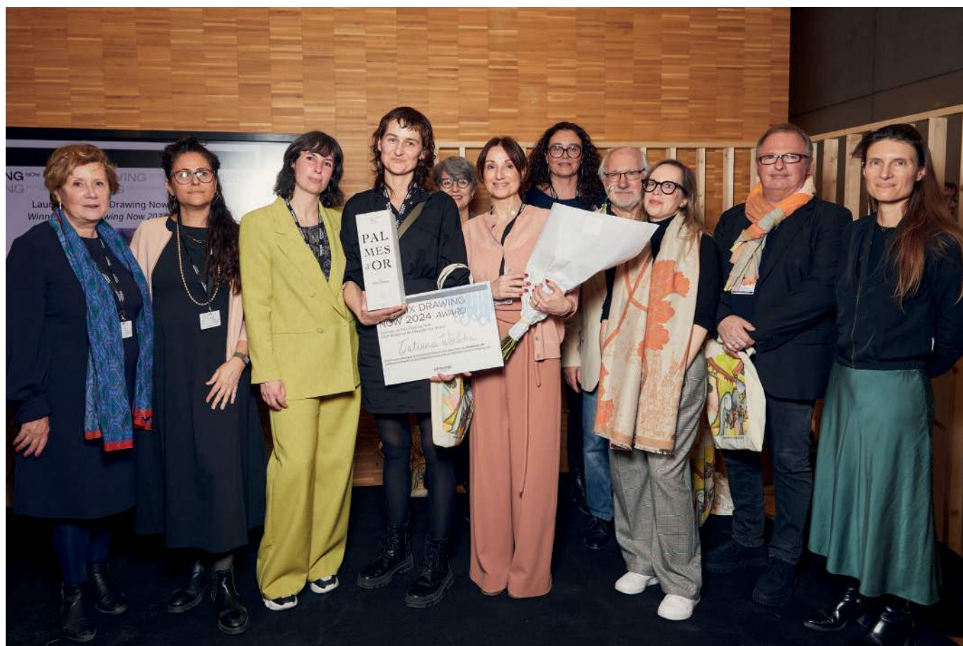
Remise du Prix Drawing Now 2024